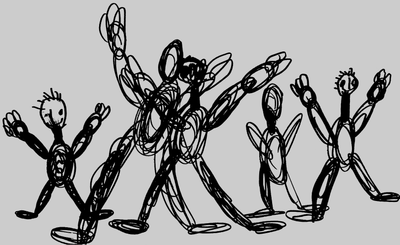
Martin Kaličiak, 5 let 1 měsíc