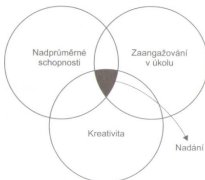
Obr. 1 Renzulliho model nadání (převzato Hříbková, 2009)

Renzulli vypracoval model nadání, ve kterém vyčlenil tři základní skupiny charakteristik osobnosti, které musí dosahovat určitého stupně rozvoje a vzájemné souhry, aby se staly předpokladem pro podávání mimořádného a tvořivého výkonu (Hříbková, 2009).