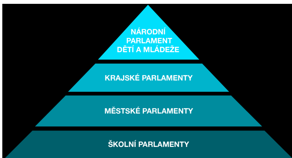
Graf č. 1; Struktura dětských parlamentů v ČR; Zdroj: http://www.npdm.eu/o-npdm/struktura-npdm/

Studentské parlamenty v České republice fungují na základě provázané čtyř úrovně hierarchie, v jejímž čele stojí Národní parlament dětí a mládeže (dále jen NPDM). Přimo pod něj spadají samosprávy na krajské úrovni, dále parlamenty městské a školní (viz Obrázek č.1).